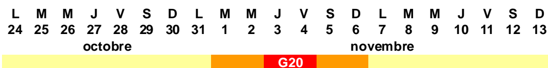
Figure 1 – Période d'étude, G20, Cannes 2011

La zone d'étude est composée de deux cercles, le premier est centré sur la zone de déroulement du G20, le deuxième concerne les communes restantes des départements du Var et des Alpes-Maritimes (Figure 2).