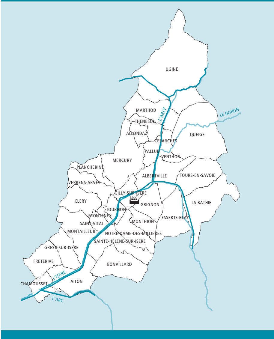
Figure 1 Zone d'étude / Figure 1 Study area